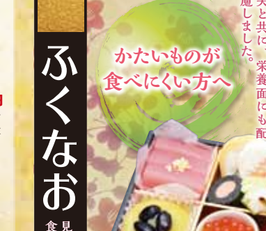
12月20日(日)迄 早期承り 250円引! で、本体価格4,750円です。

おせち 26 新含気おせちセット 紅梅 (14品) 化粧箱 29.5×24.5×7cm 本体価格 5,000円