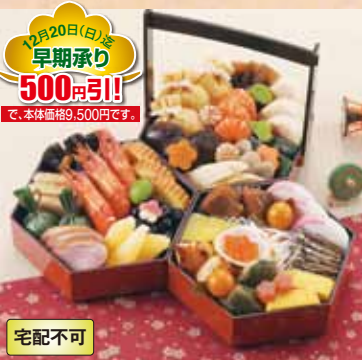
12月20日(日)迄 早期承り 500円引! で、本体価格9,500円です。

宅配不可 おせち 23 京風おせち 八坂(やさか) (32品) お重外径 18.2×15.8×4.3cm×3 本体価格 10,000円