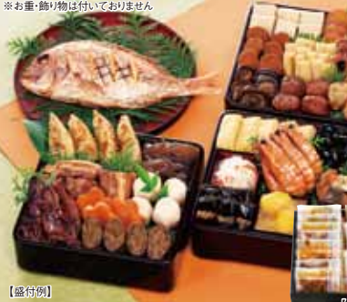
12月20日(日)迄 早期承り 600円引! で、本体価格11,400円です。

おせち 24 新含気おせちセット 五葉 (24品) 化粧箱 47×31.5×7cm 本体価格 12,000円