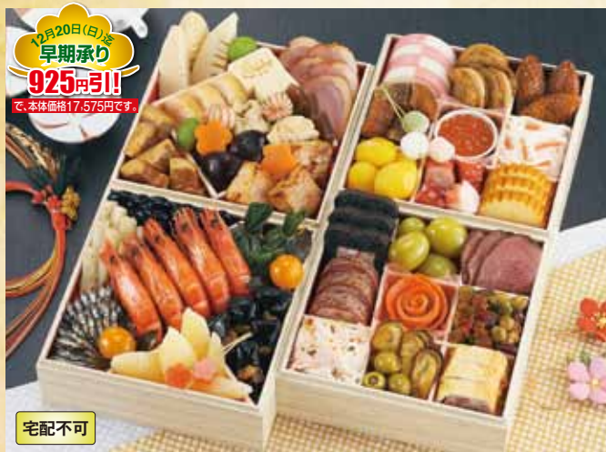
12月20日(日)迄 早期承り 925円引! で、本体価格17,575円です。

宅配不可 おせち 21 京風おせち 千都(せんと) (41品) お重外径 17.2×17.2×5cm×4 本体価格 18,500円