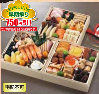
12月20日(日)迄 早期承り 750円引! で、本体価格14,250円です。

宅配不可 おせち 22 京風おせち 桂(かつら) (37品) お重外径 20.2×20.2×4.6cm×3 本体価格 15,000円