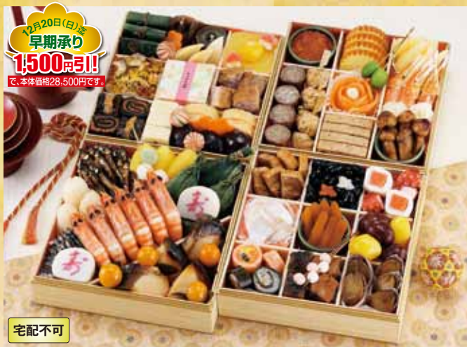
12月20日(日)迄 早期承り 1,500円引! で、本体価格28,500円です。

宅配不可 おせち 20 京風おせち 朱雀(すざく) (52品) お重外径 21×21×5cm×4 本体価格 30,000円